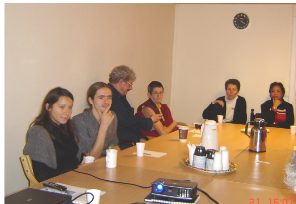
Dialogseminar i Wat Thai: noen av deltakerne

hverandre og med hvordan vi opplever det å være buddhist. Etter felles meditasjon i tempelrommet fortsatte vi med en presentasjon av seminaret og tanken bak det før vi ga ordet til hver av seminardeltakerne. Det kom også opp forskjellige forslag fra deltakerne om aktiviteter Buddhistforbundet bør sette i gang.