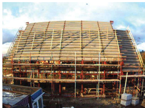
Det nye Wat Thai høsten 2006

Mandag 22. mai i år begynte byggingen på det nye tempelet til Den thailandske buddhistforening. Det var inngått avtale med byggefirma for å reise et tempel på over 900m2 og bankfinansiering til å sikre fullføring av et prosjekt på omkring 18 mill kroner var sikret. Det var derfor en stor dag når det første spadesticket kunne tas før tomte ble overlatt til gravemaskinene og sementblanderne. Templet skal stå ferdig i begynnelsen av juni neste år og offisiell innvielse er satt til 07.07.07.