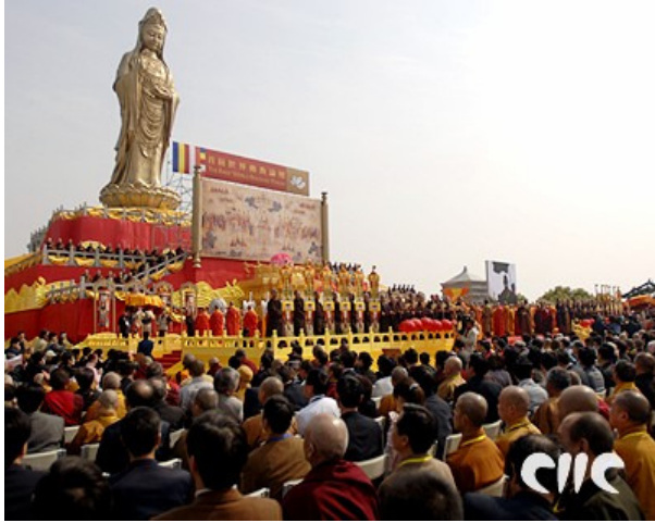
Buddhistisk seremoni for fred – Putoushan