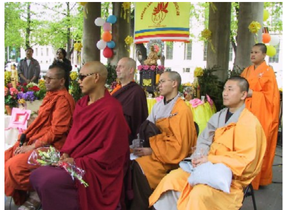
Munker fra Thailand, Tibet, Norge, Vietnam og en nonne fra Kina under vesak-feiringen utenfor Nasjonalteateret

Nytt av året var et vesak-arrangement "på gata" i sentrum av Oslo. Buddha's Light International Association (BLIA - kinesiske buddhister fra Taiwan) inviterte oss til dette arrangementet der de hadde leid musikkpaviljongen utenfor Nasjonalteateret søndag 16. mai. I løpet av to timer fikk vi både feiret Buddhas fødsel sammen og delt feiringen med tilskuere og forbipasserende på en måte som følte helt naturlig. Ingen påtregende "gatemisjon" men en fargerik "Dharma-utfoldelse" som folk kunne "snuse på" etter ønske.