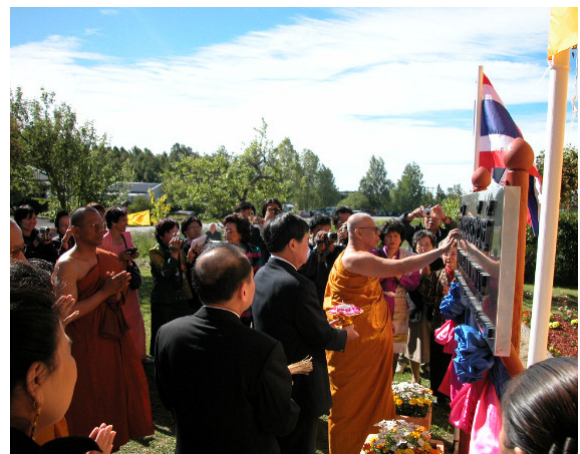
Fra innvielsen av det nye thailandske tempelet i Sørums kommune

Den thailandske buddhistforening kjøpte i 2003 et småbruk på Frogner i Sørums kommune for å etablere et thailandsk buddhist- og kultursenter på stedet med mer plass og større muligheter for utvidelser enn på den gamle eiendommen på Billingstad i Asker. Den nye eiendommen er på 16 mål og består av et bolighus og en eldre låve. I løpet av vinteren har boligen vært gjennom en omfattende rehabilitering. Mandag den 14. juni ble den tatt i bruk som bolig for foreningens to munkene. Planen er å bygge et thailandsk tempel og kultursenter på stedet. På tradisjonelt thailandsk vis ble innflyttingen markert med en buddhistisk seremoni. Den thailandske ambassadør i Norge deltok i seremonien. I tillegg kom gjester fra inn- og utland med tilknytning til Den thailandske buddhistforening, Buddhistforbundet og andre som har et forhold til thailandsk kultur. Se bilder fra seremonien på: http://www.buddhistforbundet.no/thaibf/