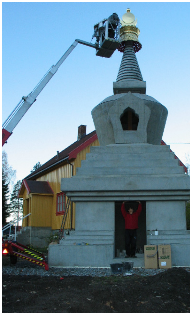
”Kronen på verket” – spiret på stupaen på Karma Tashi Ling Buddhistsenter monteres på plass.