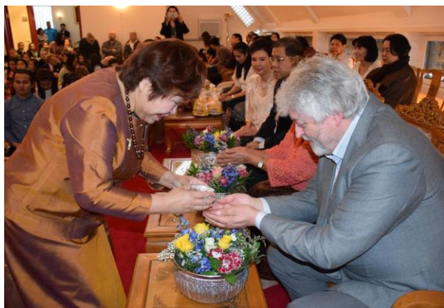
Fra songkran-feiringen i Wat Thai

Nyttår for vietnamesere, kinesere og koreanere begynte i år 8. februar (9. februar for tibetanere) som var første dag i den røde ildapens år. Midnatt søndag kveld var derfor et viktig tidspunkt over store deler av verden. Så også på Løvenstad i Rælingen der Khuong Viet tempel var fullstappet med norsk-vietnamesiske buddhister i feststemning. Undertegnede var også der og holdt en tale som Buddhistforbundets representant.