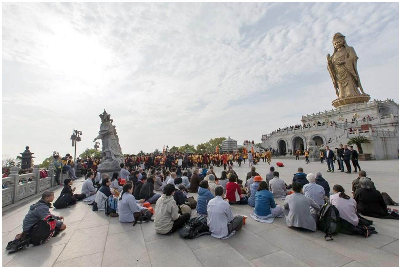
Gruppe fra Det vietnamesiske buddhistsamfunn på pilgrimsferd i Kina - foran statuen av bodhisattvaen Guanyin på øyen Putuoshan

Nyhetsbrev nr. 1 2016, vesak - år 2560 etter buddhistisk tidsregning