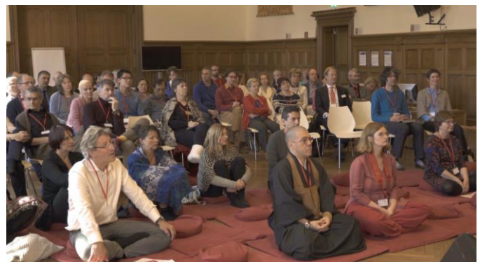
Fra EBU-seminaret i Berlin

Buddhistforbundet er medlem i «European Buddhist Union» (EBU). Det har vi vært siden 2009. Ved siden av det årlige hovedarrangementet med en tre-dagers generalforsamling / årsmøte det også et årlig møte av ledere for «nasjonale unioner» (NU). Det siktes her til de nasjonale buddhistiske organisasjonene (for tiden 13) som er tilsluttet EBU. Det siste møtet fant sted 19 – 20 mars i Frankfurt med 8 av organisasjonene representert – derav Buddhistforbundet ved forstander. Noe av tiden går med til å diskutere saker som gjelder EBU som organisasjon –