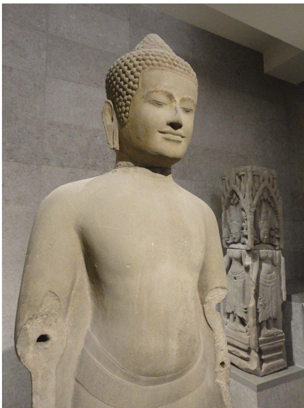
Statue av Buddha fra Kambodsja

Ser vi på denne listen kan en på den ene siden merke seg at åtte av medlemsgrupperingene gjelder personer som i hovedsak har norsk etnisk bakgrunn. Tallmessig utgjør disse 1879 personer (13%) av de i alt 14.435 medlemmene. Fem av medlemsgrupperingene har annen nasjonal / etnisk bakgrunn: Vietnam (42%), Thailand (36%), Myanmar (4%), Sri Lanka (3%) og Kambodsja (2%). Observante lesere vil kanskje legge merke til at tallene Buddhistforbundet oppgir ved årets begynnelse og tallene fylkesmannen innleverer til SSB kan avvike fra hverandre. Det skyldes at vår innleverte liste vaskes i Brønnøysund-registrene slik at en del personer fjernes fra listen. Det gjelder personer som har dødt i løpet av året (og som vi ikke har fått melding om), personer som har flyttet til utlandet, personer med ufullstendige personnumre og ikke minst personer som også står oppført i andre trossamfunns lister. Dette bruker vi en del tid på å rydde opp i ved f.eks. å kontakte direkte personer med feil personnummer / registrering i annet trossamfunn. Her er vi avhengig at det enkelte medlem responderer slik at Buddhistforbundets register kan bli korrigert.